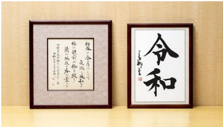
右／新たに揮毫し、署名、印を押した「令和」 左／新元号の出典となった『万葉集』の序文の一部を漢字かな交じりで揮毫した書