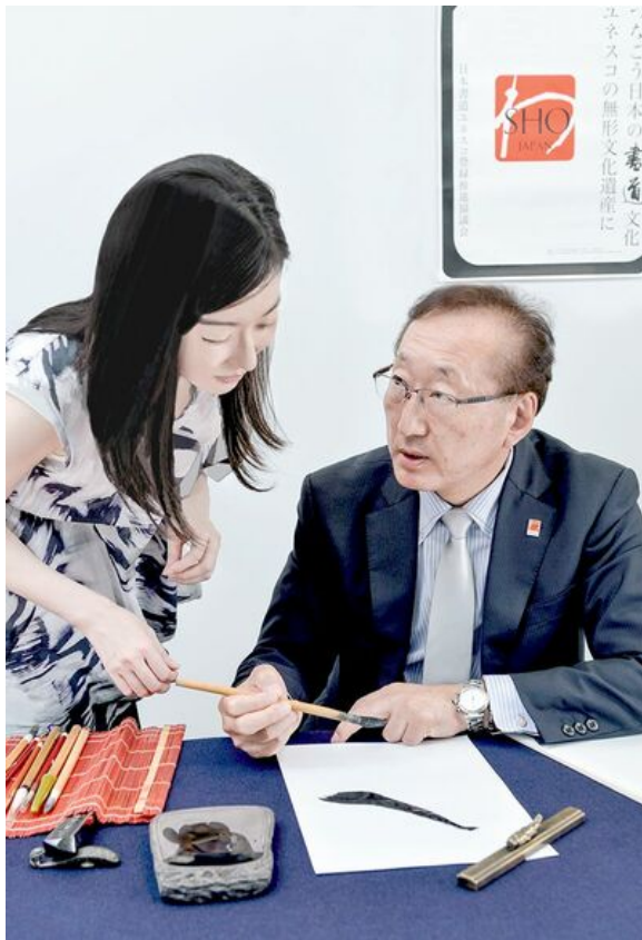
小振りの穂先にもかかわらずスケールを生み出している。まさに熟練の技