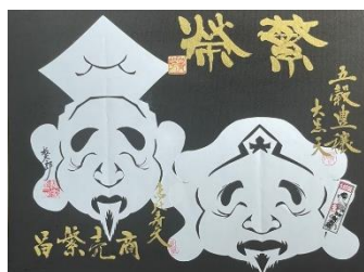
【福神-恵比寿天・大黒天-】